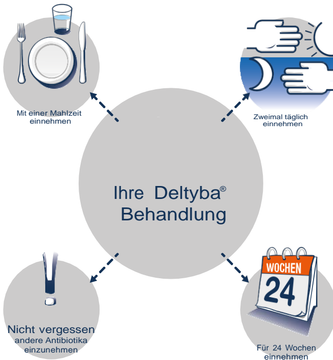
Abbildung 1: Delyba™ für die Behandlung von MDR-TB-Infektionen in der Lunge

Bitte achten Sie darauf, dass Sie alle Medikamente, die Ihnen verschrieben worden sind, ordnungsgemäß nehmen. Dadurch haben Sie die beste Chance, von MDR-TB geheilt zu werden.